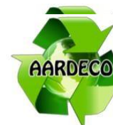
Gráfico No 1 ÁREA DE PRESTACIÓN DE SERVICIO DE AARDECO